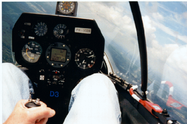
Zo zit je in een zweefvliegtuig tijdens de vlucht

Thermiek is de "motor" van het zweefvliegtuig, zonder thermiek neemt de hoogte van het zweefvliegtuig gestaag af totdat het weer op de grond staat. Thermiek is opstijgende- warme lucht. Warme lucht stijgt omdat deze lichter is dan de omgevende- koude lucht. Warme lucht ontstaat door verwarming van het aard-oppervlak door de zon. Door de verschillende terreingesteldheid wordt het aardoppervlak op de ene plek warmer dan op de andere.